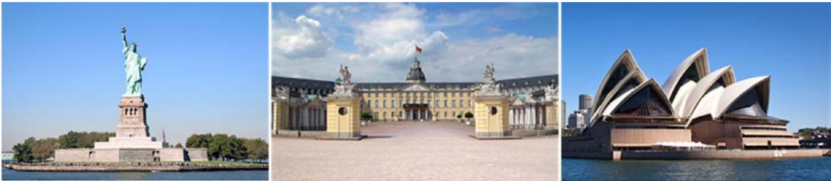
Lean in the Public Sector Conference - December 9 - 11, 2009 - KIT, Karlsruhe, Germany